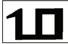
şəkil 1 şəkil 2 [4,s.34]

Ağqoyunluların tayfa başçısı Həməzə Bəyin (1437-1444) zamanından etibarən dövlətin emblemi olaraq qəbul edilmiş birinci şəkildəki damğa [13, s.8] Yazıçıoğlu Əlinin “Təvarixi əl-Səlcuq”, Seyid Loğmanın “Hünərnəmə” salnamələrində verilmişdir. Bu damğa Həməzə bəyin zamanında kəsdirilən sikkələrə də vurulurdu. Orxan Fuad Köprülü də Ağqoyunluların sikkələrində Bayandur damğasından istifadə edildiyini yazır [11]. İkinci şəkildə verilmiş damğa isə İranın cənub-qərbində yaşayan Qaşqay türklərinin milli simvolu kimi qəbul olunmuşdur ki, [4, s.38] ayrı-ayrı türk xalqlarının bayraqlarında qədim türk dövlətlərinin damğalarının işarəsinin verilməsi bizim ortaq mədəniyyətimizin daha bir təzahürüdür.