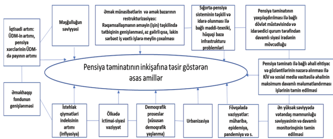
Şəkil 3. Pensiya təminatının inkişafının bağlı olduğu başlıca amillər (Müəllif tərəfindən hazırlanmışdır)

Pensiya təminatının inkişafının pensiya məbləğlərinin digər makroiqtisadi həyat səviyyəsi göstəriciləri ilə münasibətdə artımı ilə kəmiyyət, eyni zamanda təminatın özünün proses olaraq yeni institusional səviyyəyə qaldırılması ilə ölçməklə keyfiyyət baxımından inkişaf etdiyini qəbul edərsək, pensiya təminatının inkişafına təsir göstərən amilləri və onların təsiri imkanlarını aşağıdakı sxematik təsvirlə icmallaşdırma bilirik (Şəkil 3.):