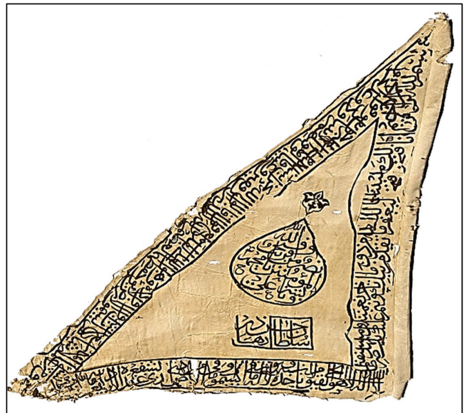
Ağqoyunlu hökmdarı Uzun Həsənin bayrağı (XV əsr)

Hal-hazırda Uzun Həsənin bayrağı İstanbuldakı Milli Saraylar - Topqapı Sarayında saxlanılır. Bu bayrağın Milli Saraylar - Topqapı Sarayında qorunması barədə Türkiyə və Azərbaycan tədqiqatçılarının əsərlərində məlumatın verilməsinə baxmayaraq, məhz ilk dəfə Dövlət Bayrağı Muzeyi tərəfindən onun inventar nömrəsi və saxlandığı fond müəyyən edilmiş və növbəti elmi tədqiqat mövzusu olmuşdu. Belə ki, Türkiyə Milli Saraylar İdarəsi Başqanlığına göndərilmiş 12.10.2023-cü il tarixli rəsmi müraciətimizə cavab olaraq Topqapı Sarayı tərəfindən Uzun Həsənin bayrağının surəti bizə göndərilmişdir. Ağqoyunlu hökmdarı Uzun Həsənin bu bayrağı Azərbaycan tarixşünaslığında ilk dəfə olaraq təqdim olunan məqalədə ayrıca problem kimi elmi tədqiqata cəlb olunmuşdur.